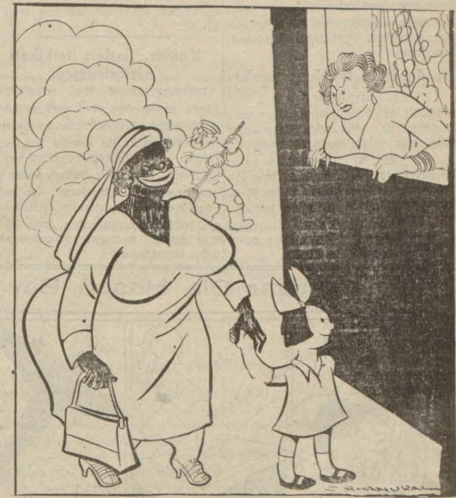
Şekerleme ve karamellâların içine toprak karıştırılmıyormuş. — Gazetelerden — — Kız, çocuğu toz toprak içinde dolaştırma diye sana tenbih etmedim mi? — İlâhi hanımıcığım, meraklandığın şeye bak, onu biz ka remelâ ile büyüttük.

Ankara 11 (Hususi) — Devlet teşkilâtındaki ihtisas mevkilerini tesbit eden kanun lâiyhası bugün Mecliste müzakere edilmiş ve bu münasebetle bazı hatibler söz ala-rak mükteşeb hakların muhafazası maksadile lâiyhaya encümence kon-muş olan hükme itiraz etmişlerdir. Neticede yeniden tetkike tâbi tu-lmak maksadile lâiyha encümene-iade olunmuştur.